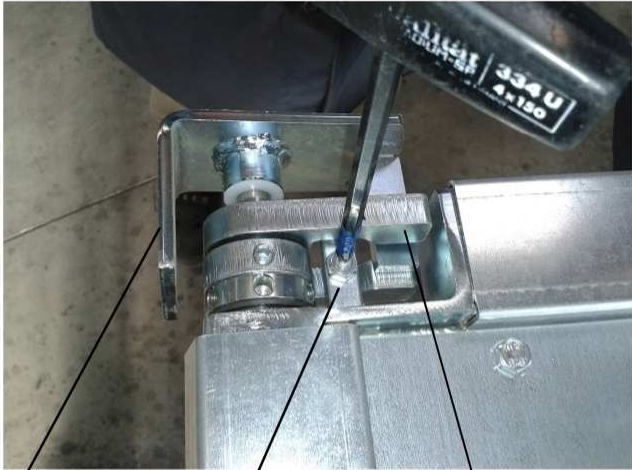
Lager oben Justierschraube mit Kontermutter Schließerbacken