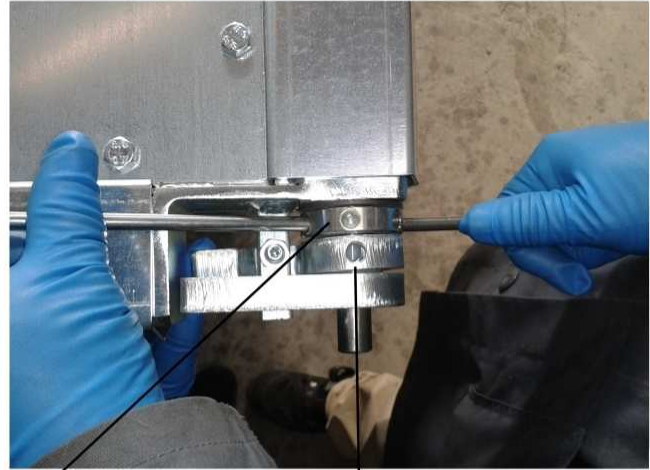
Spannbuchse mit 6 Bohrungen Loch für Gewindestift